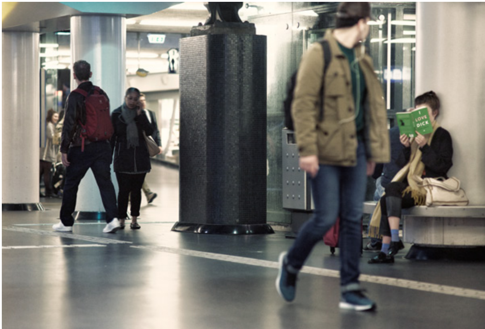
SLUIMERENDE LITERATUUR Een kleine twintig jaar na verschijning bracht een jongere generatie auteurs het boek weer onder de aandacht.