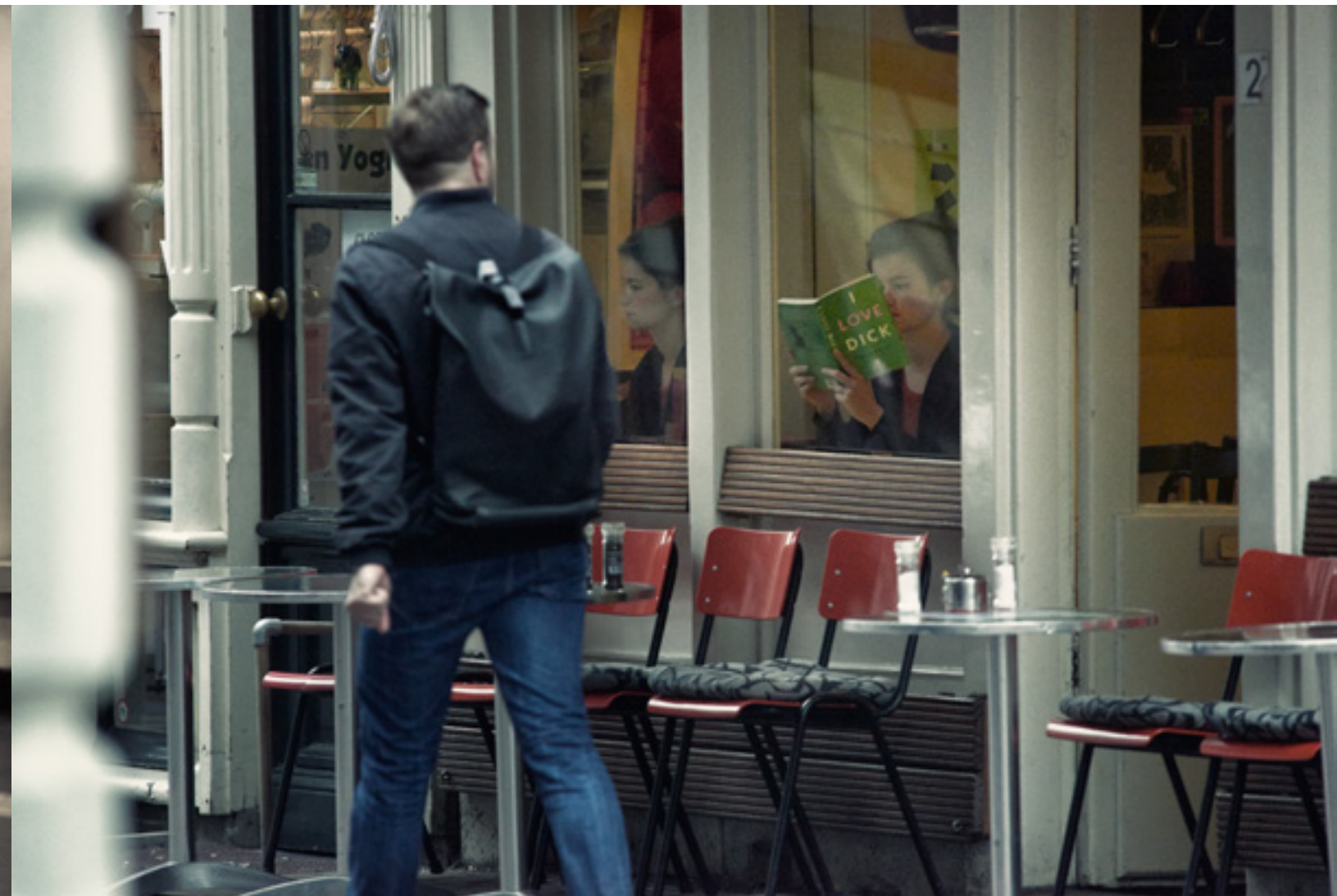
NEE, HET IS MEER DAN JE DENKT Leg maar eens uit dat ze brieven over schizofrenie schrijft en Félix Guattari citeert.

I K PROBEER AL EEN TIJDJE BRIEVEN (MAILS) UIT TE WISSELEN MET EEN ANDERE SCHRIJVER. Het leukste daaraan zijn de gesprekken die in het hoofd ontstaan wanneer het weer bijna tijd wordt om terug te schrijven. In die gefantaseerde gesprekken zijn alle woorden zorgvuldig gekozen en begripen wij elkaar volledig. En wanneer we elkaar niet begrijpen, biedt het onbegrip de mogelijkheid met een geweldige uitleg te komen. Waarna wederzijdse bewondering volgt voor wat als een godsverschijning in ons midden staat: de woorden. Wij buigen als dienstbare aanbidders voor de taal die ons bindt. Every letter is a love letter , stelt Chris Kraus in I Love Dick . Wij, de schrijvers die elkaar schrijven, hebben de woorden zo lief dat de mails die we elkaar sturen een soort dubbele liefdes-mails worden: eerst is er de bewondering voor de taal, dan de bewondering voor jezelf wanneer je die taal voldoende eert en dan pas de bewondering voor de ander.